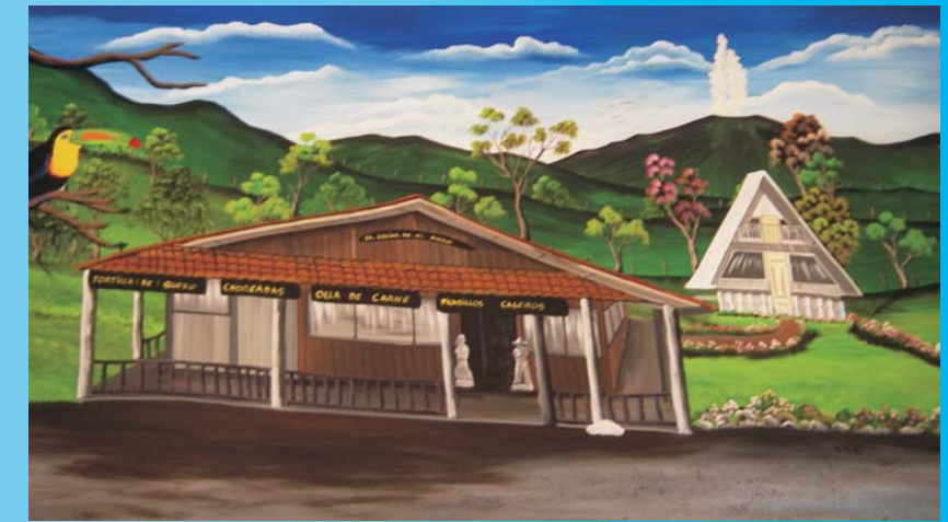
Pintura con el penacho de gases del volcán Turrialba, según lo miran los vecinos en arte popular, foto de GJSoto (ICE).