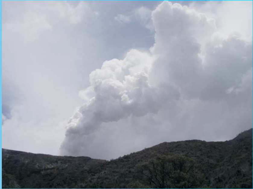
Penacho de gases del volcán Turrialba, expelidos desde la "Fumarola 05012010", vistos desde el sureste de cráter activo, 30 de julio del 2011, foto de GJSoto (ICE).