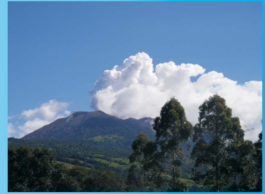
Penacho de gases del volcán Turrialba, expelidos desde la "Fumarola 05012010", vistos desde el suroeste del volcán, 30 de julio del 2011.