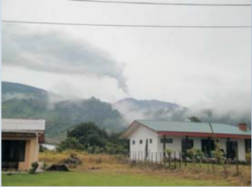
Penacho de gases del volcán Turrialba, desde Cervantes, 3 de agosto del 2010, foto de Federico Avilés (ICE).

Recolección de muestras: Servicio al Cliente, ICE Turrialba Análisis de muestras: Laboratorio Químico ICE Interpretación y mapa: G.J. Soto Área de Amenazas y Auscultación Sísmica y Volcánica, PySA, ICE