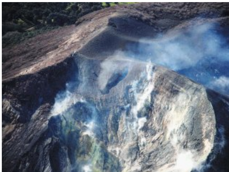
Foto del cráter del volcán Turrialba en donde se puede apreciar la abertura longitudinal desde la cual se iniciaron las emanaciones de gases y ceniza en el mes de enero.