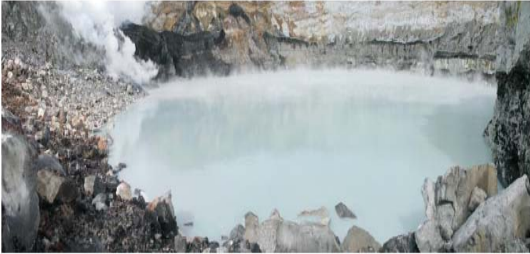
Foto 2: Lago del volcán Poás, se observa la liberación de gases desde la pared del domo

El lago caliente del volcán Poás continúa con una actividad fuerte e intensa. Su temperatura es de 42 °C. y el pH es de cero. En noviembre el lago alcanzó su nivel más bajo en los últimos 15 años.