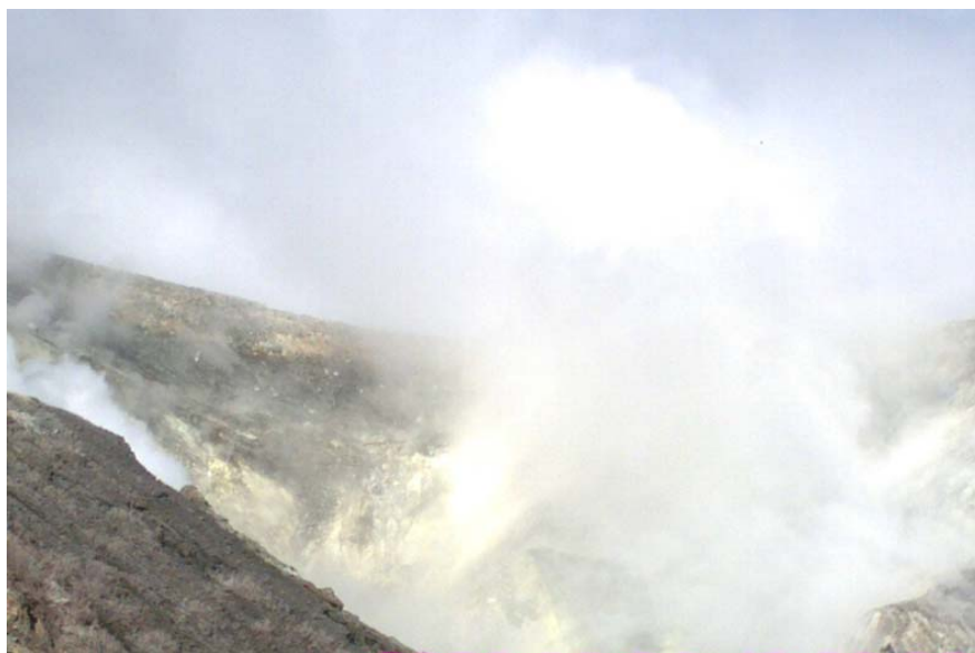
Foto 1: Volcán Turrialba. Cráter en donde se observa la acumulación de azufre en las paredes del área de fumarolas (W. Rojas, Oct. 2009)

Recomendaciones: Es necesario mantener restringido el acceso de turistas dado que aún la actividad gaseosa es muy intensa y la vía de evacuación no han sido reparada.