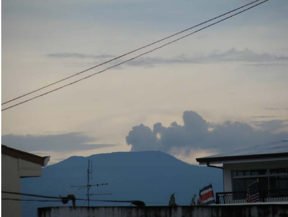
Foto 2: Tomada desde el sector de Montes de Oca, Universidad de Costa Rica.

Algunas personas han llamado al Centro de Investigaciones en Ciencias Geológicas (CICG) de la Universidad de Costa Rica , preguntando por una columna de cerca de un kilómetro de alto, sobre el volcán Poás, que asemeja una erupción (Foto 2).