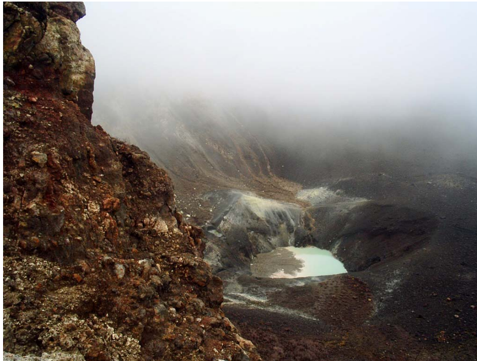
Foto 1: Volcán Turrialba. Cráter central en el cual se ha formado una laguna (W. Rojas, agosto 2009)