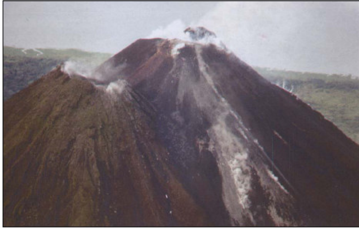
Figura 2: Foto de los diferentes domos y cráteres formados en el antiguo cráter C. El cráter D se encuentra a la izquierda de la fotografía.

Durante los meses y años siguientes, el edificio volcánico se fue reconstruyendo y ya para el año 1996 se encontraba con una nueva pared (figura 1B). Durante los años siguientes, el cráter de lava desapareció y se inició la formación de domos (Figura 2), de los cuales han salido varias coladas de lava, especialmente hacia el norte y el noroeste.