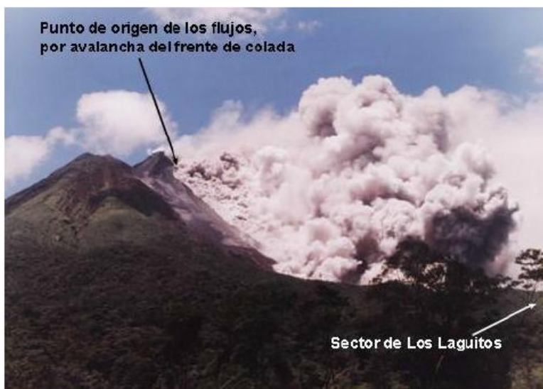
Figura 3: Flujo piroclástico del 5 de setiembre del 2003.

Periódicamente, de las partes altas de esas coladas de lavas se producen caída de bloques y desprendimientos de frentes de coladas de lava cuyos resultado es la ocurrencia de flujos piroclásticos, y que hasta cierto punto son considerados como normales. La figura 3 es un ejemplo de estos flujos piroclásticos.