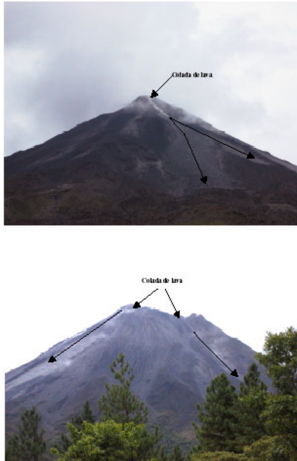
Figura 5: Dirección preferenciales de la caída de bloques y coladas de lava vistas desde el oeste (foto superior) y del sur (foto inferior) desde el Arenal Observatory Lodge.

Los últimos días del mes de mayo se caracterizaron por un incremento en los registros del movimiento de lava, indicador claro de que las salida de lava continuará hacia la casa del guardaparques (flanco oeste), hacia el suroeste y hacia el sur. La figura 5 muestra dos tomas desde el flanco oeste (fotografía superior) y desde el Arenal Observatory Lodge en el flanco sur (fotografía inferior). Las flechas indican la trayectoria actual de la caída de bloques y las coladas de lava. Muy posiblemente también sean las direcciones que tomen los futuros flujos piroclásticos.