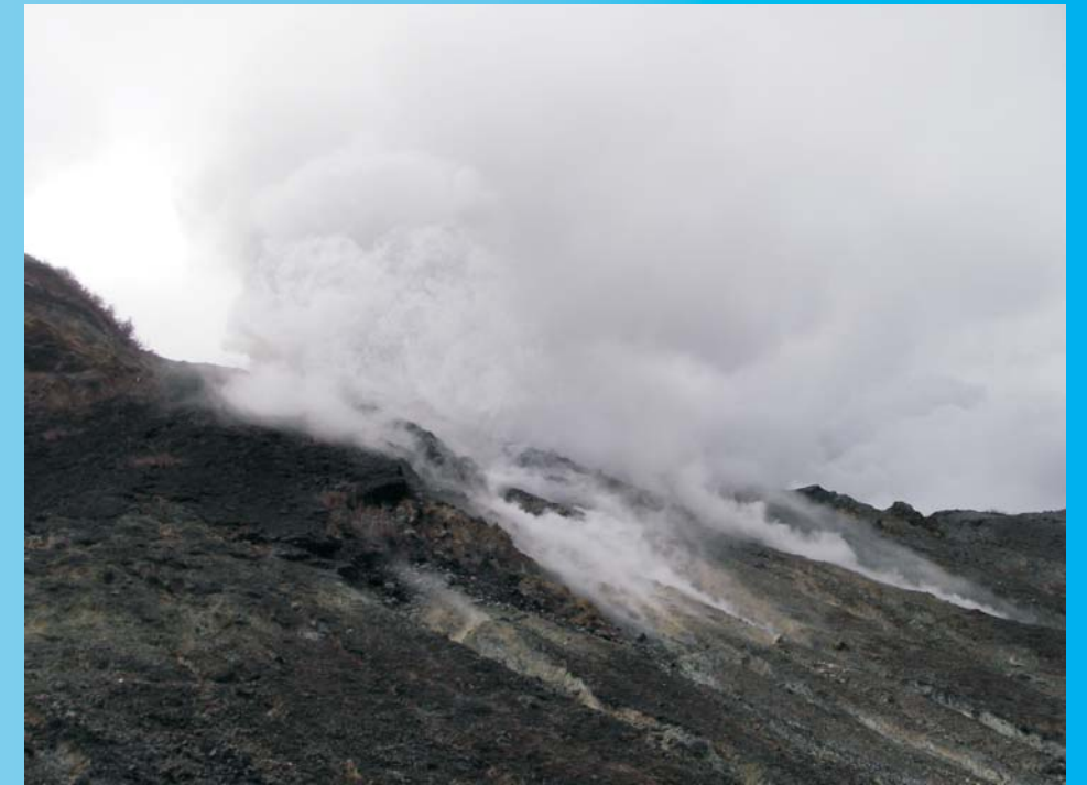
Penacho fumarólico en el nuevo boquete fumarólico 12012012, en la pared del cráter suroeste del volcán Turrialba, visto desde el cráter central. 20/01/2012.