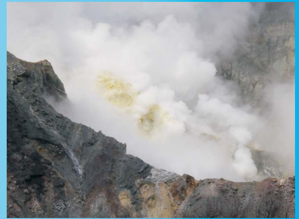
Actividad fumarólica en el cráter suroeste del volcán Turrialba, visto desde el cráter central. 03/05/2011.