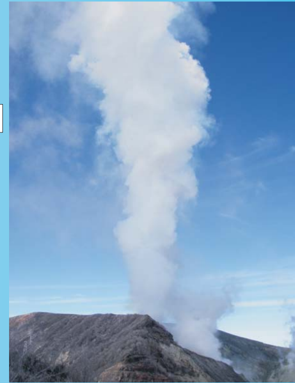
Penacho de gases del volcán Turrialba, visto desde el mirador en la cima. 10 de marzo del 2011.