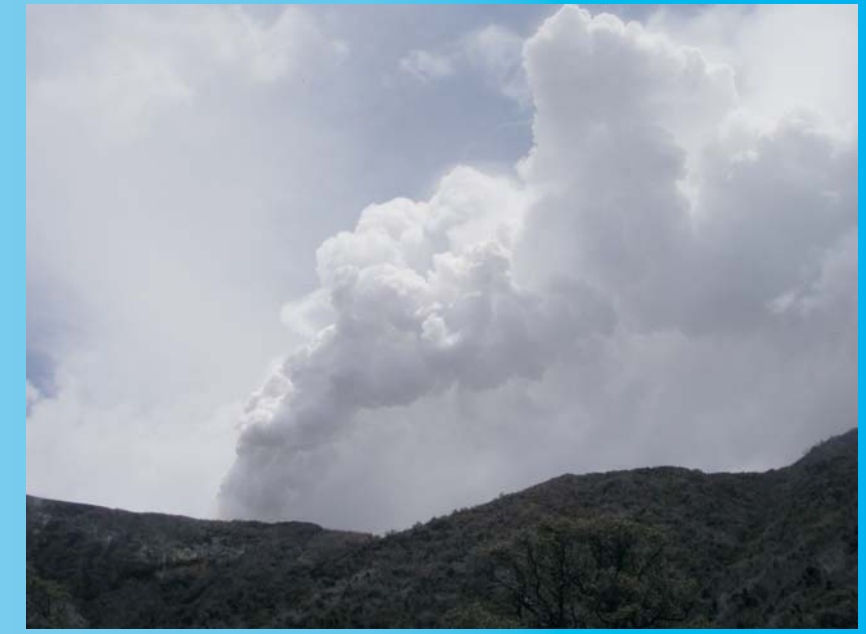
Penacho de gases del volcán Turrialba, expelidos desde la "Fumarola 05012010", vistos desde el sureste de cráter activo, 30 de julio del 2011, foto de GJSoto (ICE).