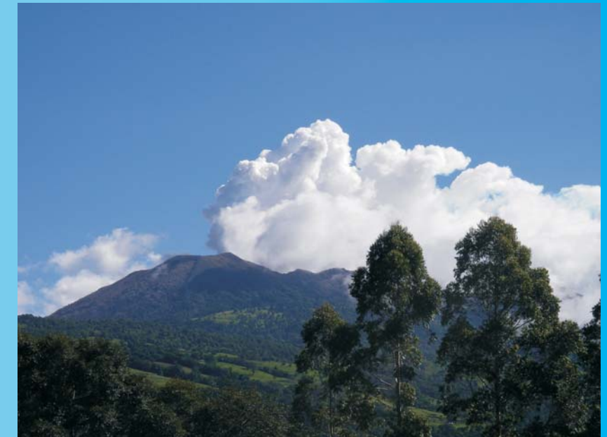
Penacho de gases del volcán Turrialba, expelidos desde la "Fumarola 05012010", vistos desde el suroeste del volcán, 30 de julio del 2011.