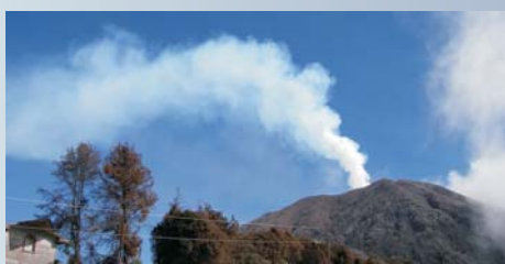
Penacho de gases del volcán Turrialba, desde La Central, al suroeste del cráter activo, 26 de enero del 2011, foto de GJSoto (ICE).

Recolección de muestras: Servicio al Cliente, ICE Turrialba Análisis de muestras: Laboratorio Químico ICE Interpretación y mapa: G.J. Soto Área de Amenazas y Auscultación Sísmica y Volcánica, PySA, ICE