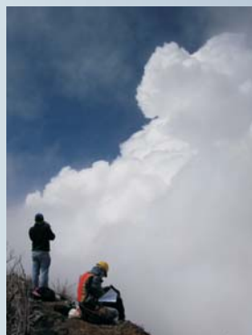
Penacho de gases del volcán Turrialba, desde el borde este del cráter suroeste 25 de noviembre del 2010, foto de GJSoto (ICE).