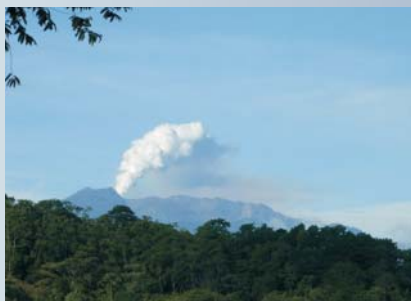
Penacho de gases del volcán Turrialba, desde La Alegría de Siquirres, 2 de noviembre del 2010, foto de Edwin Garita (ICE).