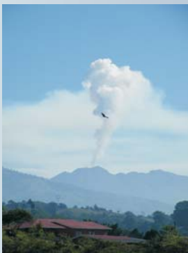
Penacho de gases del volcán Turrialba, desde Paraíso, 18 de abril del 2010, foto de Luis Madrigal (ICE).