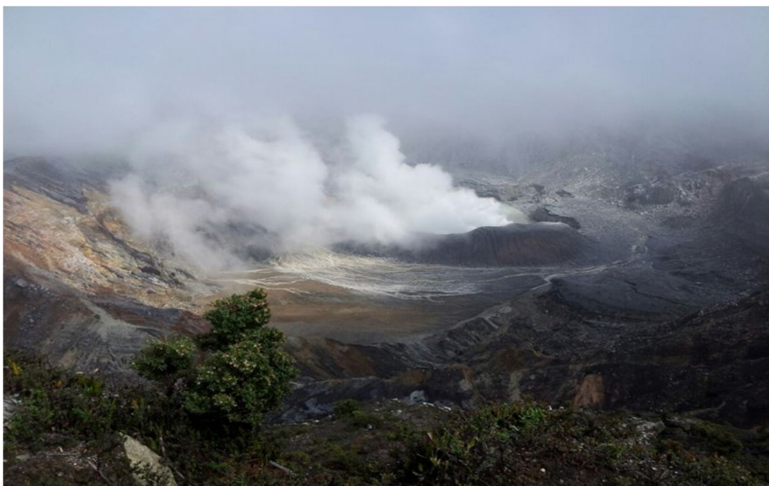
Foto 1: Aspecto del cráter del Poás luego de las erupciones del 28 de octubre