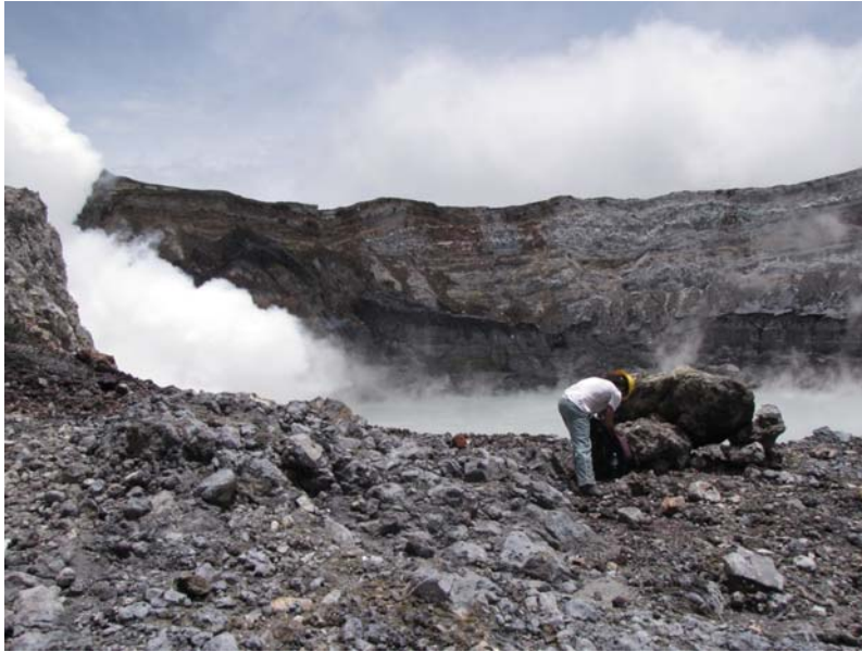
Foto 3. Toma muestras de azufre y líticos hidrotermalizados que el lago lanza con sus erupciones freáticas. Al fondo, al lado izquierdo, el domo emanando gases a alta temperatura.

Durante el mes de mayo del 2010 se observaron al menos 6 erupciones freáticas provenientes de la Laguna Caliente del volcán Poás. Posiblemente la erupción más fuerte, fue la ocurrida el 29 de mayo del 2010. Esta erupción generó “chorros” de lodo que bañaron parte de las paredes del intracráter, especialmente hacia el sector Sur y Oeste.