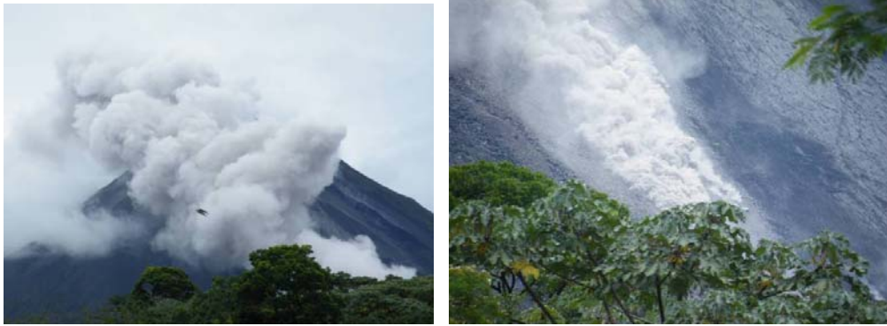
Foto 1 y 2: Izquierda: Gases y cenizas finas emitidas por los flujos piroclásticos del 24 de mayo a las 12:10. Sector sur-suroeste del volcán. Derecha: Frente de un flujo piroclástico del 24 de mayo a las 12:10.

Posteriormente a esta actividad, el frente de colada de lava se activó y emitió continuos bloques que se transportaron por gravedad ladera abajo, rebotando y rodando hasta depositarse en los abanicos de bloques cerca de los 800-900 m de altitud. Los bloques, con interiores incandescentes por las altas temperaturas (cerca de 1000 °C), son vistos “al rojo vivo” incluso en horas diurnas. Por otra parte, el conducto, al quedar relativamente liberado de la coraza de lava superior, ha permitido una actividad explosiva más intensa que en los últimos días, con frecuentes explosiones estrombolianas, que proyectan bloques y cenizas hasta un altura de 200-300 m sobre el cráter. Los bloques caen en proyección balística en la periferia del cráter y las cenizas son transportadas por los vientos alisios predominantes, que van principalmente hacia el oeste. No obstante, con la entrada de los vientos del Pacífico, hay también proyección de ceniza hacia el norte y hacia el noreste del volcán.