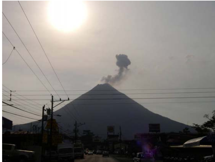
Foto 1: Penacho de cenizas de explosión estromboliana del Arenal a las 16:05 del 23 de febrero del 2010, vista desde La Fortuna.

La actividad exhalativa es intensa desde la cima. Hay ocasionales explosiones estrombolianas menores, con proyección de penachos de ceniza de algunas decenas a centenas de metros de altura máxima (Figura A). Bloques de lava continúan rodando desde frentes cercanos a la cima en el sector WNW (Foto B) y en el sector NNW (Los Lagos).